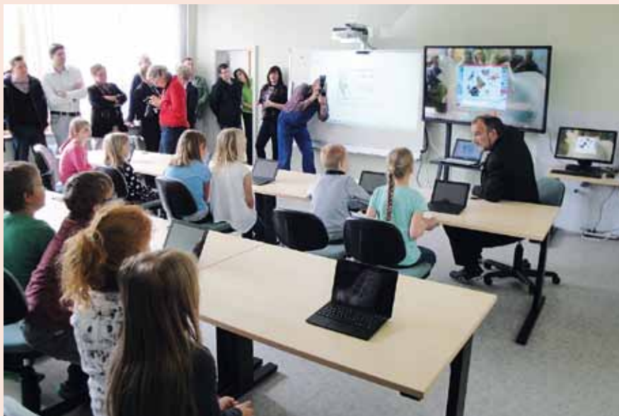
Am 28.05. nahm die Freie Landschule Osterhausen (bei Eisleben) zur Freude ihrer Schüler|innen ein modernes Computerkabinett in Betrieb.