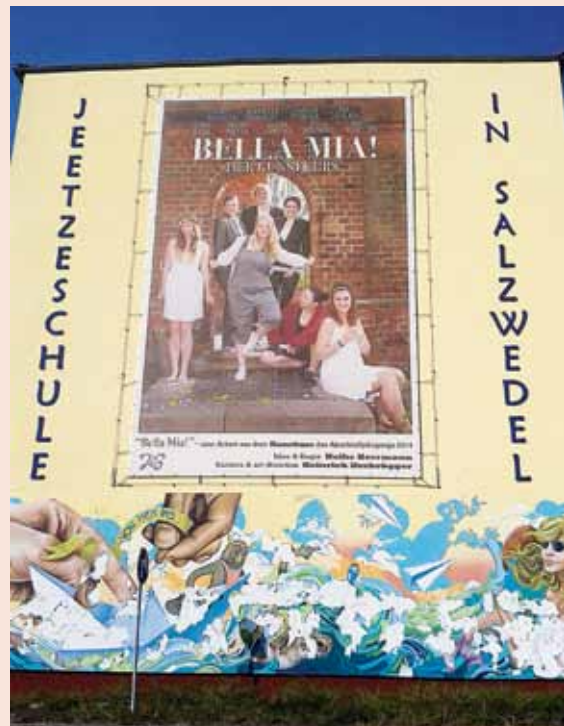
Seitenansicht der Jeetzeschule Salzwedel mit einem überdimensionalen Schülerplakat