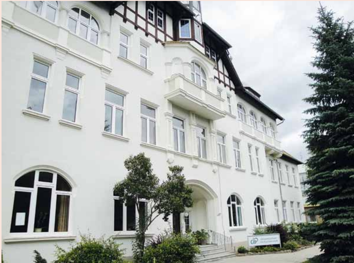
Feierte am 10.07. ihr 5-jähriges Jubiläum: Die Freie Gesamtschule im Gartenreich in Oranienbaum