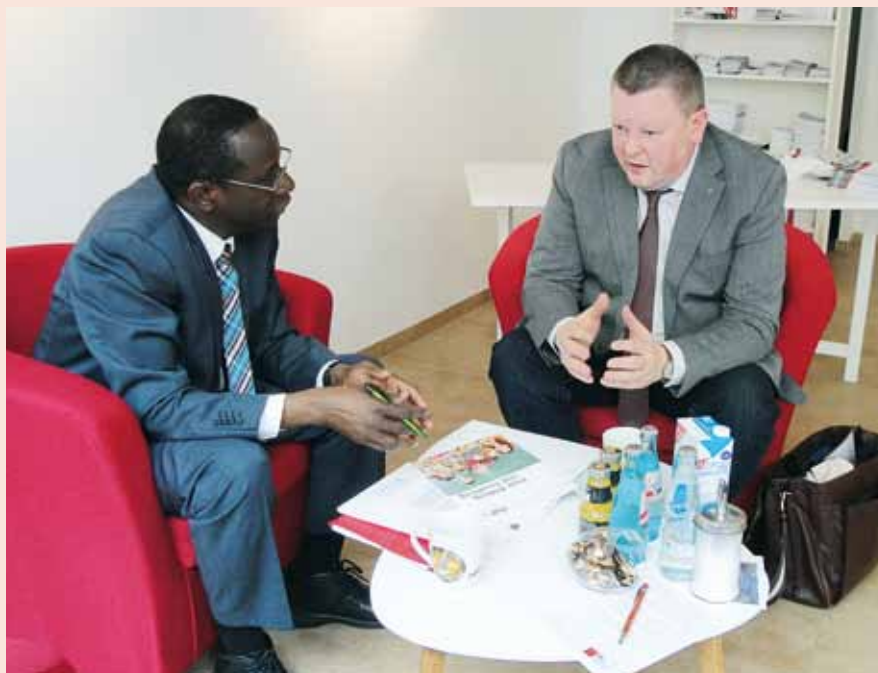
Intensives Gespräch mit Dr. Karamba Diaby über verschiedene bildungs- und arbeitsmarktpolitische Fragen in dessen Abgeordnetenbüro in Halle/Saale